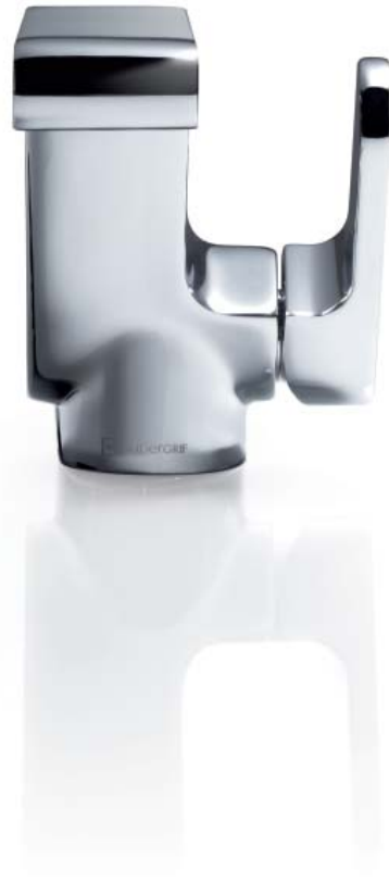
BASIN MIXER MODERN FLOW