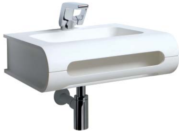
WASHBASIN SMART AND COMPACT