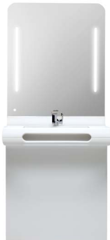
WASHBASIN WHITE ELEGANCE IN RESIN