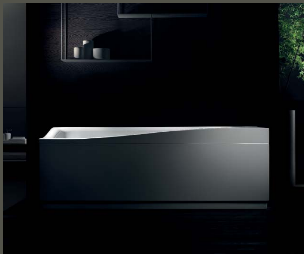
IOSA GHINI DESIGN