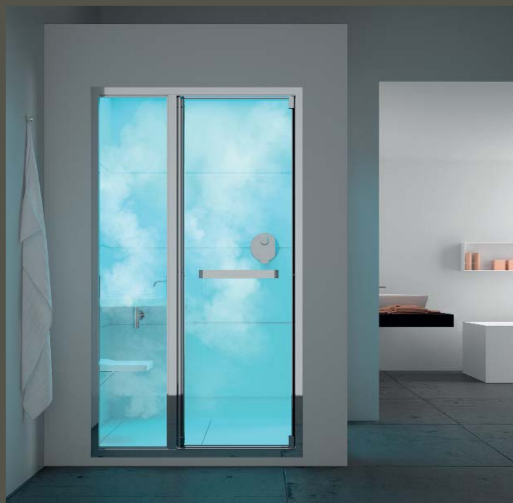
ANGELETTI RUZZA DESIGN