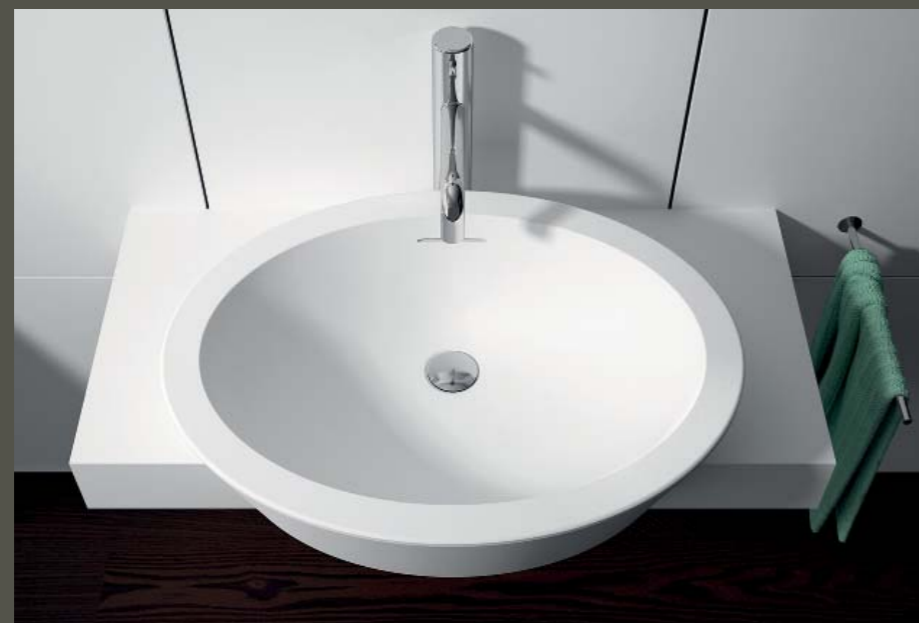
STUDIO TRANSIT DESIGN