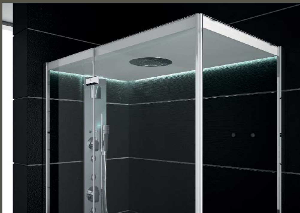
ANGELETTI RUZZA DESIGN